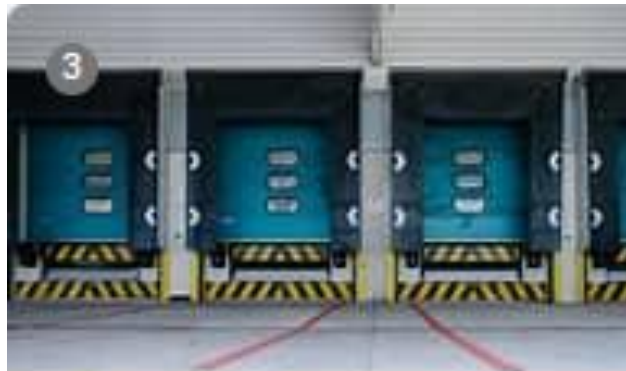
Tollbehandling - NHO Logistik og Transport