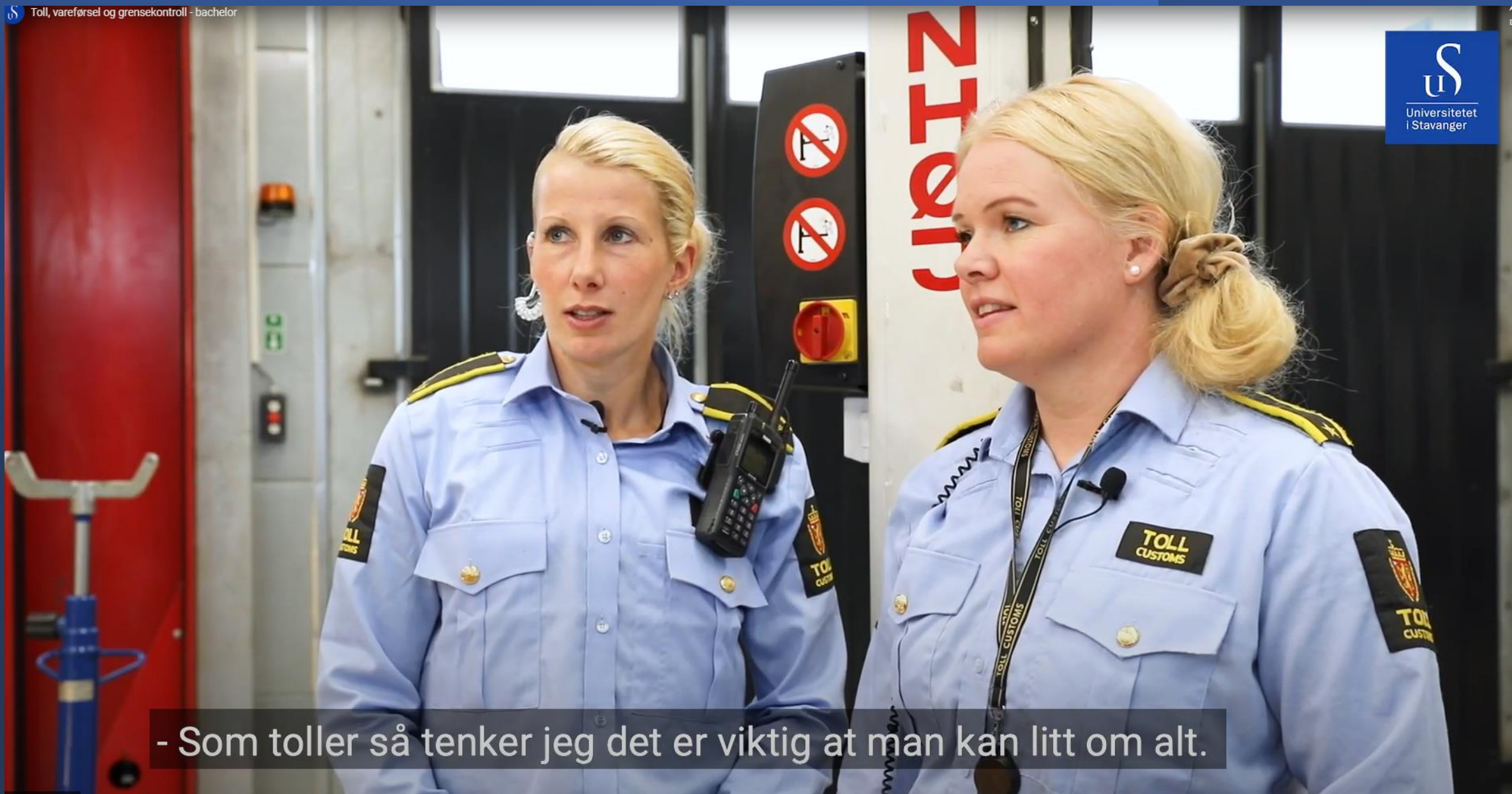
- Som toller så tenker jeg det er viktig at man kan litt om alt.