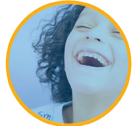
Livshendelser og sammenhengende tjenester