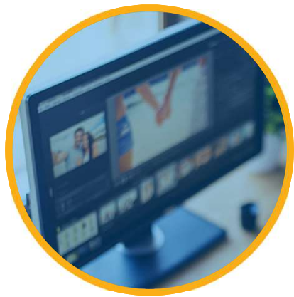
Nye oppgaver og register